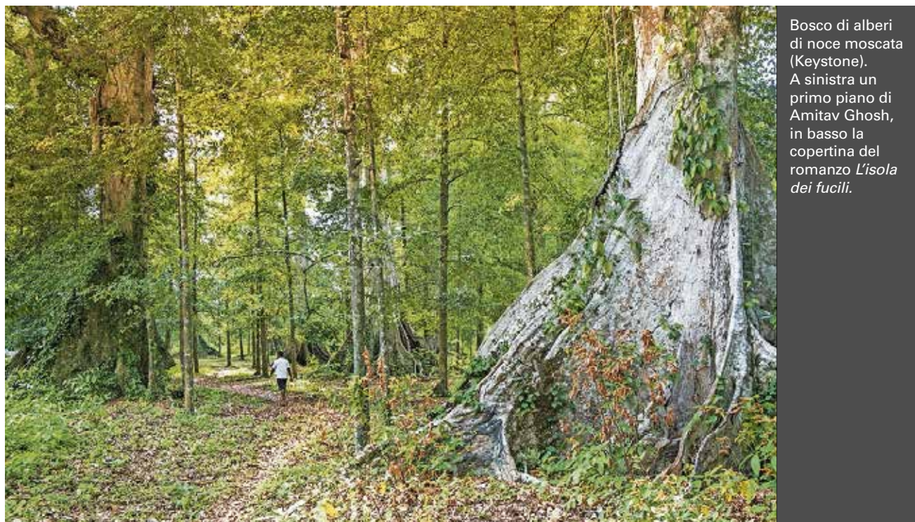
Bosco di alberi di noce moscata. A sinistra un primo piano di Amitav Ghosh, in basso la copertina del romanzo L'isola dei fucili .

Alla base della questione climatica di oggi c'è un problema di natura geopolitica. Faccio un esempio: quando i paesi industrializzati chiedono all'India, all'Indonesia o alla Cina di tagliare le loro emissioni di CO 2 , loro rispondono: Perché pro-